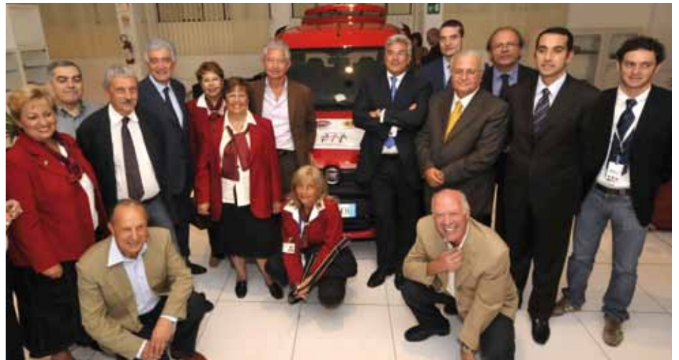
Un momento della cerimonia di consegna dell'auto ai volontari dell'Ail

hanno organizzato manifestazioni, tornei e serate di beneficenza con l'obiettivo di raccogliere i fondi per l'acquisto dell'auto, e grazie al contributo della Fiat. Ale. Tu.