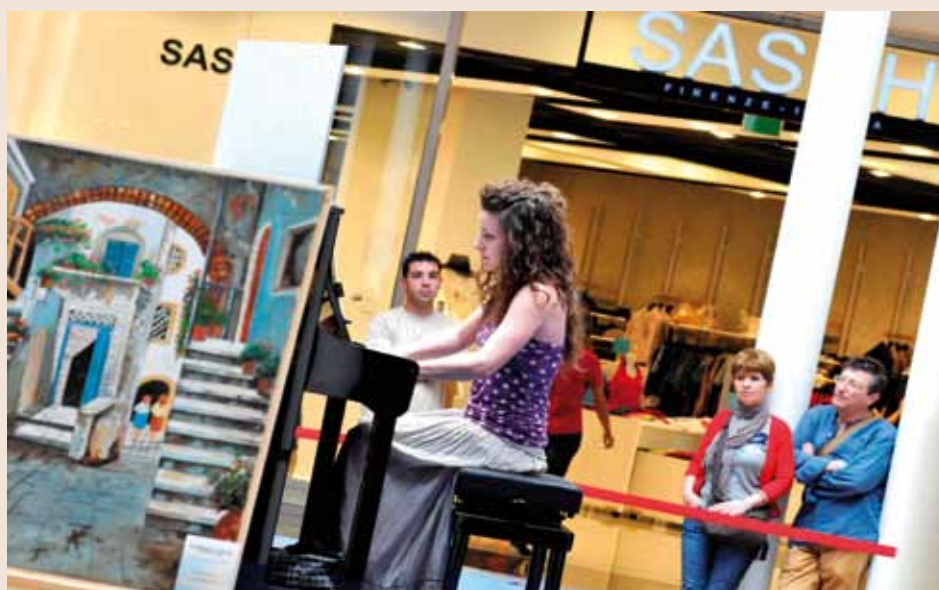
Un'esibizione di artisti del Conservatorio Bellini al Forum di Palermo

R accolti già 6.500 grazie al progetto "Ora! Per Ora", l'iniziativa del Conservatorio Vincenzo Bellini di Palermo per condividere valori come l'importanza della cultura musicale e la sua qualità al servizio della solidarietà sociale. Partner del progetto è il centro commerciale "Forum" di Palermo, che mette a disposizione degli artisti e dei volontari lo spazio per le esibizioni, in cui vengono valorizzati talenti siciliani, e per la raccolta fondi in favore delle attività di volontariato dell'Ail.