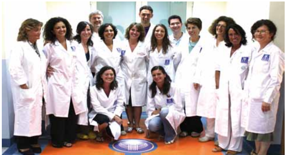
L'équipe del Laboratorio di diagnostica integrata oncoematologica dell'unità operativa complessa di Ematologia degli ospedali riuniti Villa Sofia-Cervello