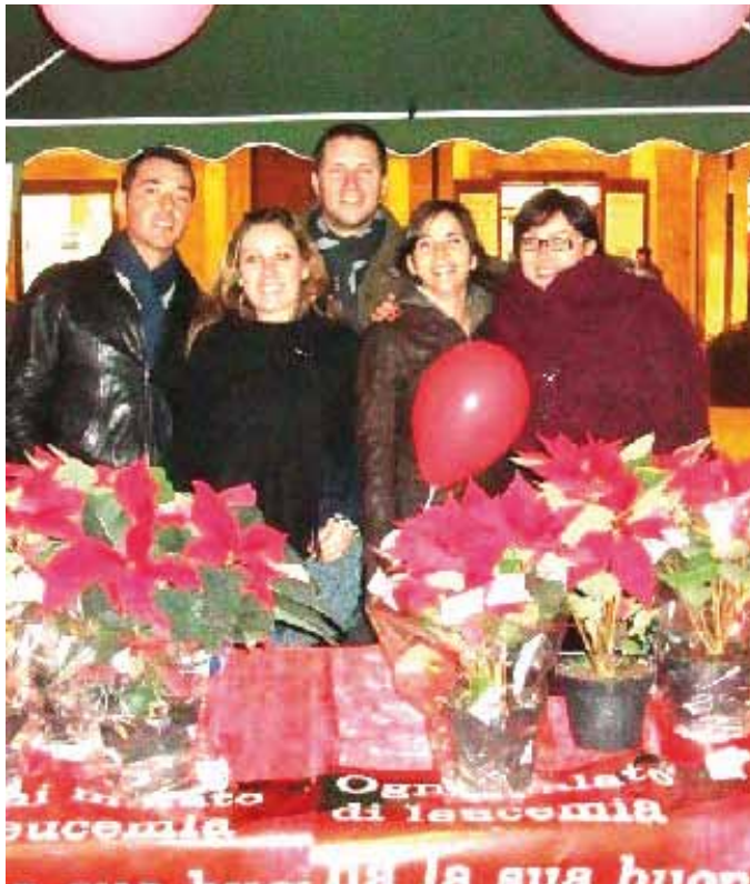
Uno stand con i volontari di Mazara del Vallo, durante la campagna delle stelle del 2009

E ancora in provincia di Palermo ad Aliminusa, Alia, Bagheria, Belmonte, Caccamo, Campofelice, Campofiorito, Camporeale, Carini, Caltavuturo, Castelbuono, Castelcaccia, Collesano, Cefalù, Cerda, Corleone, Contessa Entellina, Ficcarazzi, Finale di Pollina, Gangi, Giuliana, Geraci, Gratteri, Godrano, Isola delle Femmine, Lascari, Misilmeri, Montemaggiore, Montelepre, Partinico, Petralia Soprana, Petralia Sottana, Piana degli Albanesi, Polizzi, Pollina, Prizzi, Roccapalumba, San Mauro Castelverde, Sciarra, Termini Imerese, Terrasini, Trabia, Ventimiglia, Villabate. In provincia di Trapani, oltre al capoluogo, ad Alcamo, Calatafimi, Castelvetro, Custonaci, Marzala, Mazara, Paceco, Partanna.