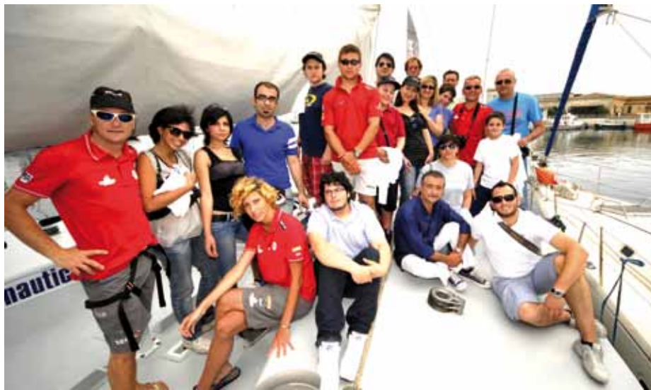
Un momento di Itacaday a Palermo, quando la barca a vela "Campione del Garda" Maxi Farr 80 ha fatto tappa al Circolo velico Canottieri Palermo