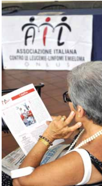
Una manifestazione a sostegno di Ail

I bambini che si ammalano di leucemia guariscono nell'80 per cento dei casi. Oltre la metà dei pazienti con linfoma non Hodgkin torna a una vita normale. L'uso di un nuovo tipo di farmaci per la leucemia mieloide cronica ha allungato la prospettiva di vita da 36 mesi alla possibilità di una sopravvivenza indefinita. I soldi investiti nella ricerca per combattere leucemie e linfomi si vedono nei risultati raggiunti negli ultimi anni. Si è ridotta la mortalità, sono state messe in campo terapie meno invasive e più mirate, è migliorata la qualità della vita dei pazienti. Per questo conviene donare il proprio denaro all'Ail, che contribuisce alla ricerca scientifica e all'assistenza ai malati. Sono migliaia i cittadini che già lo fanno, tu puoi essere tra questi.